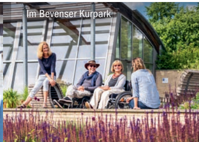
Im Bevenser Kurpark