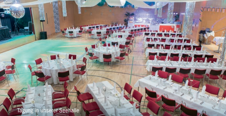
Tagung in unserer Seehalle