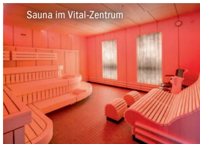
Sauna im Vital-Zentrum

Selbstverständlich ist das Vital-Zentrum des Hotels mit Schwimmbad, Sauna und Dampfbad für Sie kostenlos zugänglich. Und sollten Sie sich doch kulinarisch Verwöhnen lassen, begrüßen wir Sie gerne im Restaurant.