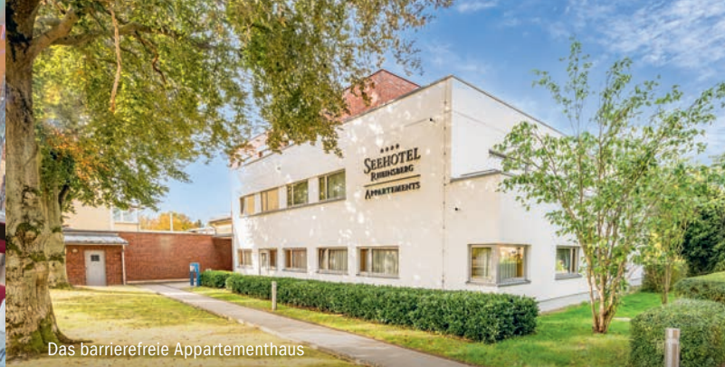
Das barrierefreie Appartementhaus