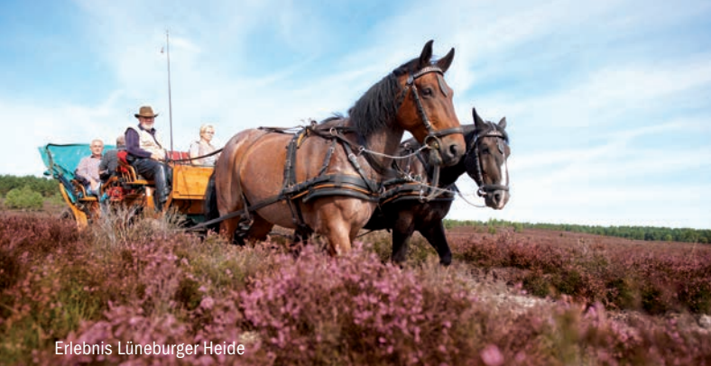
Erlebnis Lüneburger Heide